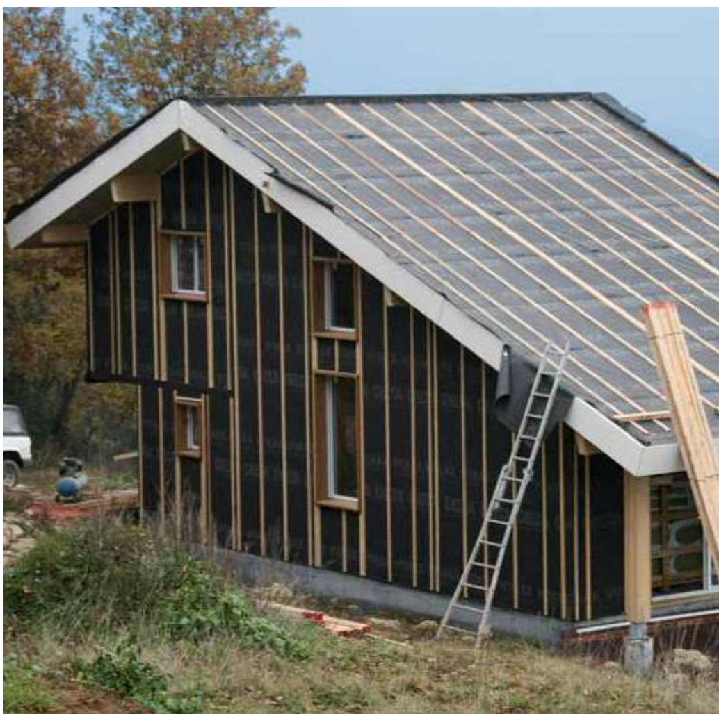
DELTA®-VITAXX PLUS utilisé sur le toit et sur la façade du bâtiment.