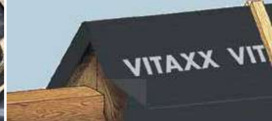
Crête de toit fermée par une membrane.