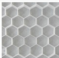
Nidagravel 129 wit 120x80x2,9cm