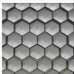
Nidagravel 129 zwart 120x80x2,9cm